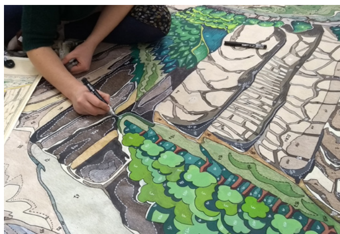
Tracé du carton pour la 5 e tapisserie Tolkien, Rivendell .

La notion de "tapisserie à 4 mains" (celles de l'artiste créateur et celles du lissier interprète textile) ainsi que la présence d'une filière de production complète furent deux axes prépondérants lors de l'inscription de la tapisserie d'Aubusson au Patrimoine culturel immatériel par l'UNESCO, seront particulièrement à l'honneur à l'occasion des Journées européennes du Patrimoine, les 21 et 22 septembre 2019 : un grand rendez-vous entre le public et les savoir-faire d'Aubusson, dix ans tout juste après l'inscription à l'UNESCO, pour découvrir le processus de création d'une tapisserie, du carton au tissage.