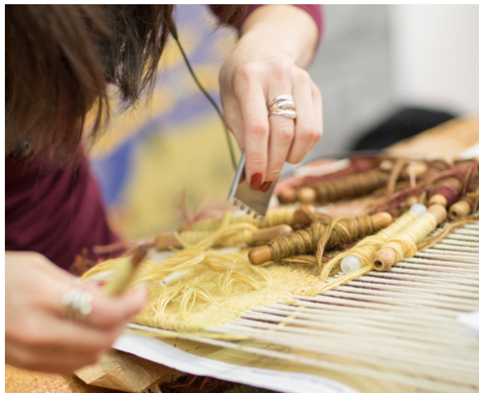
L'Atelier A2 tisse Clément Cogitore.