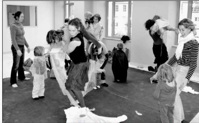
Journée nationale des assistantes maternelles à Aubusson... un métier qui s'est professionnalisé, avec des structures support partenaires d'institutions.

Les nounous sont devenues des assistantes maternelles. Ce changement de terminologie révèle une professionnalisation de ce corps de métier. Des formations sont organisées pour répondre au mieux à l'évolution des enfants dont elles ont la charge. Mais les parents ne doivent pas oublier qu'ils ont des obligations d'employeurs envers elles !